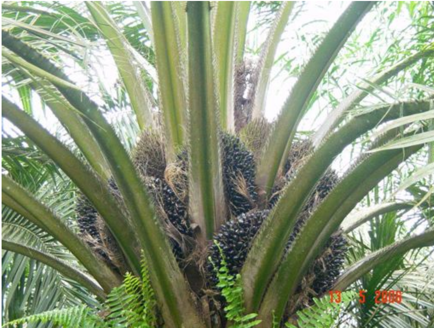
Buah terbentuk di setiap ketiak daun (keliling pohon), perkebunan di Jambi